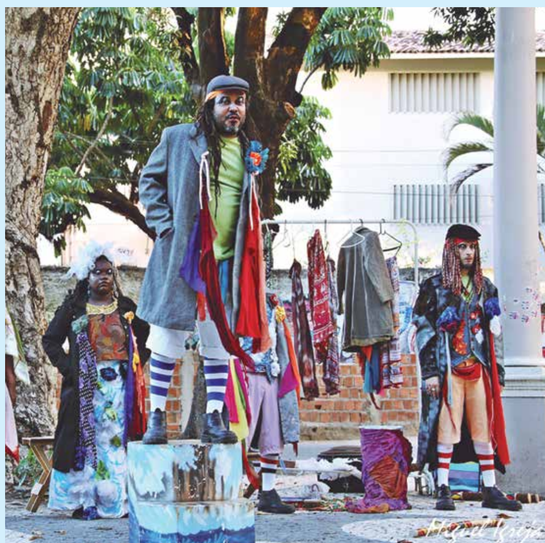
A montagem do grupo pernambucano é uma adaptação da obra poética de Marco Pólo Guimarães

O projeto foi iniciado em Recife, nos dias 27 e 30 de março deste ano. Depois de João Pessoa, o grupo passa ainda por Natal e Maceió no início do mês de maio. Em cada cidade são realizadas duas apresentações, sendo uma localizada mais central e outra na periferia. Todas as apresentações são gratuitas. O grupo pretende, dessa forma, levar a poesia marginal pernambucana para outras capitais do Nordeste e estabelecer uma relação entre o fazer teatral de rua do Recife e o das outras cidades.