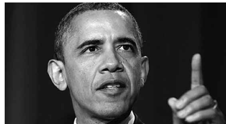
Obama já admite uma ação militar para derrubar o regime sírio

"A comunidade americana de espionagem concluiu, com diferentes graus de certeza, que o regime sírio utilizou armas químicas em pequena escala na Síria, em particular (gás)