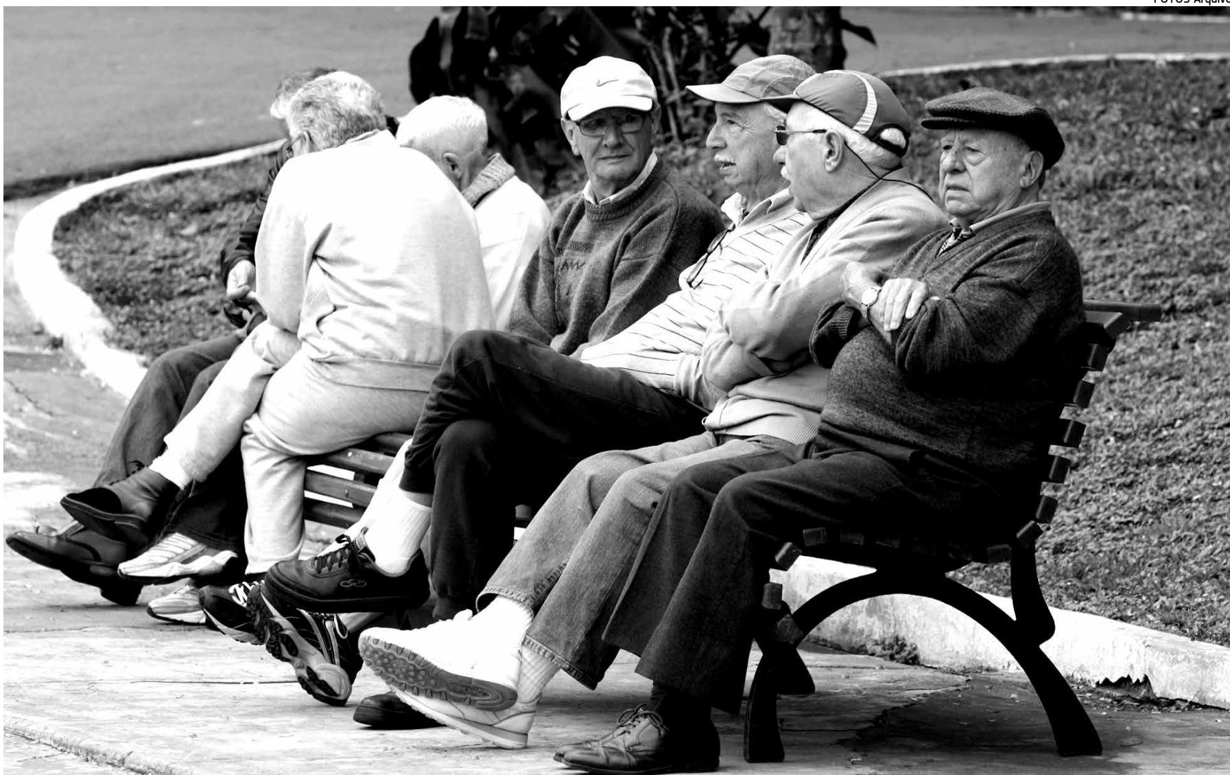
Idosos são alvo de golpista que promete doar medicamento e dinheiro em troca da senha bancária; cinco cidadãos já teriam sido lesados pelo bandido