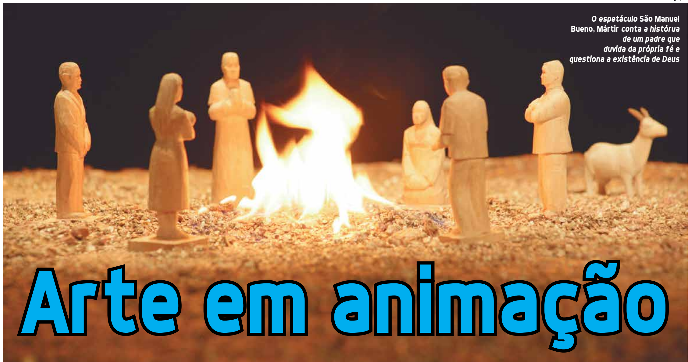
O espetáculo São Manuel Bueno, Mártir conta a história de um padre que duvida da própria fé e questiona a existência de Deus