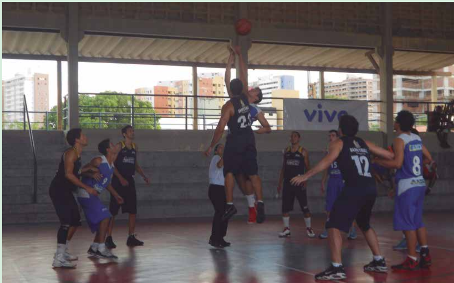
A Supercopa Nordeste de Basquete está entrando na sua fase mais importante com as quatro melhores equipes classificadas na disputa do título

A Supercopa Nordeste de Basquete está se aproximando da fase final estadual. Entre os dias 17 e 19 de maio serão disputados os jogos do quadrangular final quando será definida a equipe masculina que vai representar a Paraíba na fase final regional, programada para o final de maio, em Salvador. Estão classificadas para o quadrangular as equipes da AABB e o Cabo Branco, ambas de João Pessoa, o Campinense de Campina Grande e o Guarabira da cidade do mesmo nome. No feminino, a equipe que vai representar a Paraíba na competição já foi definida. Trata-se da Maurício de Nassau, que se sagrou campeã da fase estadual e tem vaga garantida para os jogos de Salvador.