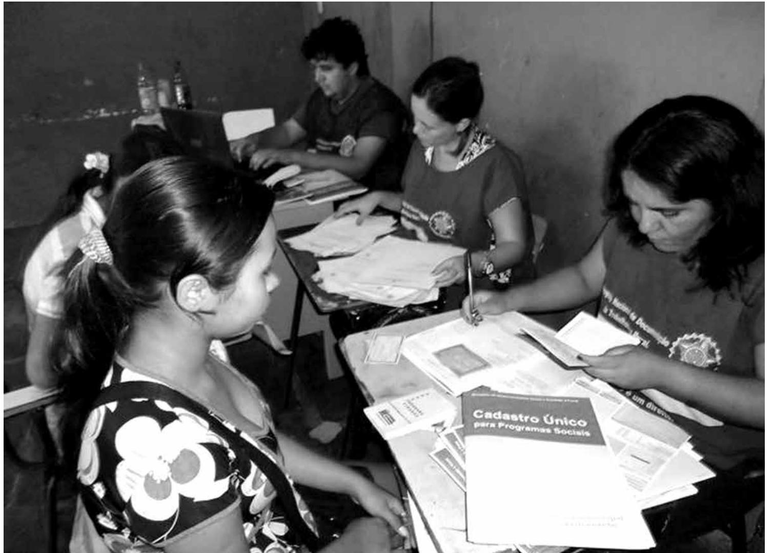
O Programa de Documentação da Mulher Trabalhadora garante, gratuitamente, registro de nascimento, carteira de identidade e CPF

A prioridade nos atendimentos é dada às mulheres, como parte das ações do