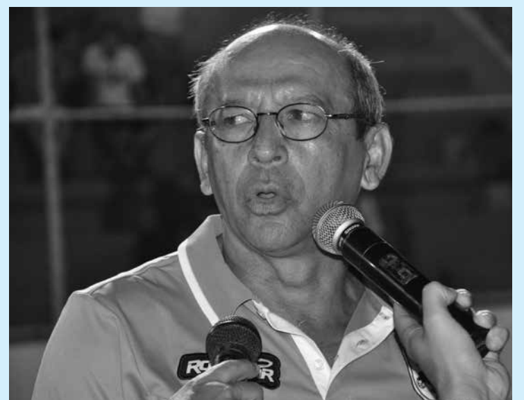
Neto quer apagar a má impressão deixada contra o CSP na Graça

Segundo ele, os jogadores ficam com uma expectativa e ansiedade, mas não podem misturar as coisas para não atrapalhar o planejamento. "São coisas diferentes que devemos separar para que não tenhamos problemas. Vamos primeiro focar as atenções no Treze para depois pensar no Coritiba", disse.