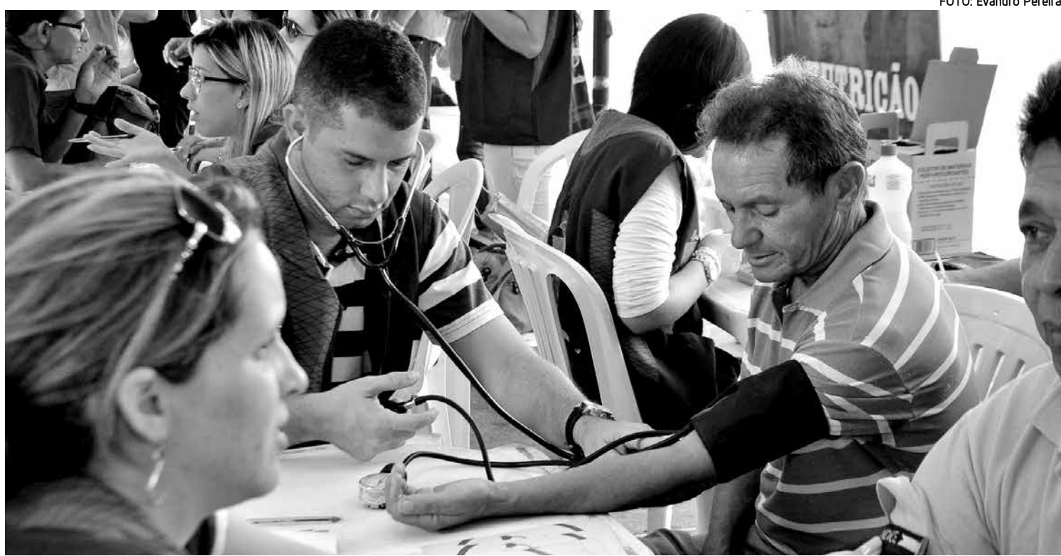
Vários serviços de saúde foram oferecidos ontem à população, como verificação de pressão arterial, no Ponto de Cem Réis

A data para a convocação e a contratação dos aprovados ainda não foi definida