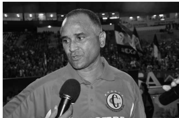
Canindé diz que mudança de postura foi fundamental para vitórias

dor raposeiro, a mudança de postura do Campinense no Campeonato Paraibano, mesmo jogando a maioria das partidas com um time misto, deve-se ao trabalho de conscientização imposto ao elenco. "Nós temos um grupo muito qualificado e isso tem nos ajudado muito. Mas tem